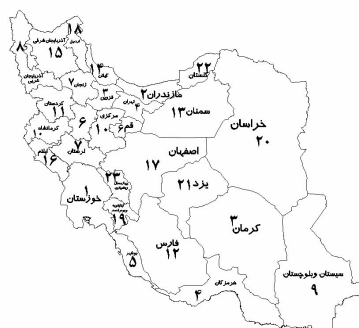
نقشه ۱. نمایش رتبه استان‌ها در فعالیت گاو‌داری شیری در نقشه ایران - نقشه ۲ - نمایش رتبه استان‌ها در فعالیت گاو‌داری پرواری در نقشه ایران