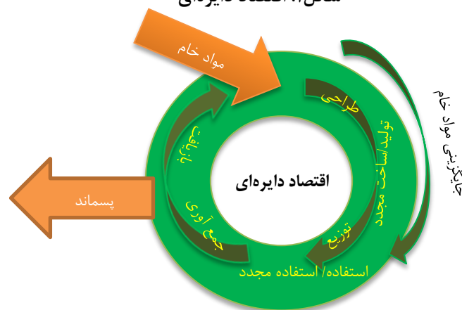
شکل ۱. اقتصاد دایره‌ای

اقتصاد دایره‌ای، رویکردی جهت ارتقاء مزیت رقابتی، رشد اقتصادی پایدار و ایجاد شغل جدید است (اتحادیه اروپا، ۲۰۱۵). این اقتصاد به عنوان یک سیستم بازبایی و بازاستفاده منابع محسوب می‌شود تا با ارتقاء عملکرد پایدار منابع، کاهش آلودگی محیطی و هزینه‌ها و بهبود در بازیافت پسماند، بتواند عملکرد اقتصادی سیستم را بهبود بخشد (Grafstrom & Aasma, 2021). شکل (۱) چهارچوب اقتصاد دایره‌ای را نشان می‌دهد.