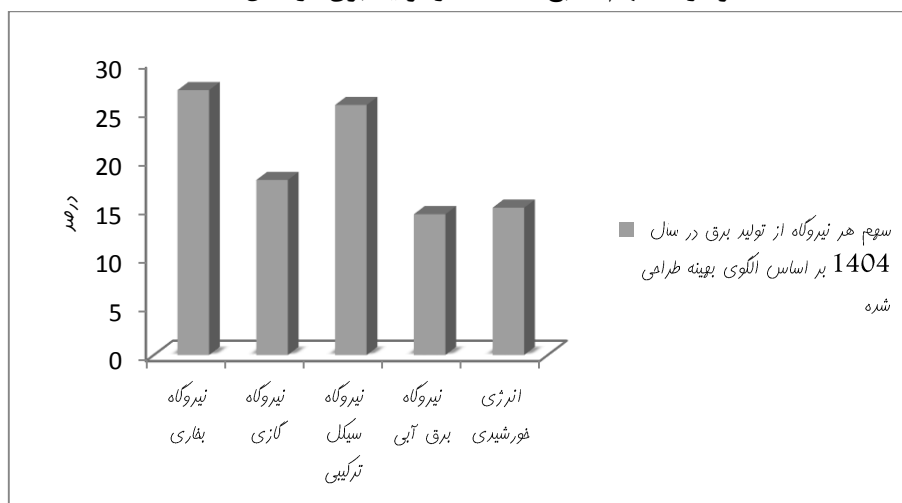
نمودار ۱. سهم منابع مختلف در تولید برق در سال ۱۴۰۴

بنابراین با توجه به مقادیر بهینه به دست آمده، پیش بینی می‌شود مصرف سوخت در سال ۱۴۰۴ در نیروگاه‌های مختلف مطابق جداول زیر باشد.