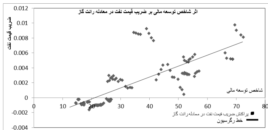
نمودار ۲. اثر شاخص چندبعدی توسعه مالی بر ضریب قیمت نفت در معادله رانت گاز

چنان‌که در نمودار شماره ۱ و ۲ مشاهده می‌شود، شاخص چندبعدی توسعه مالی، دارای اثر مثبتی بر نحوه اثرگذاری قیمت نفت در معادله رانت نفت و رانت گاز می‌باشد؛ بدین معنی که تقویت اثر مثبت قیمت نفت در دو معادله رانت نفت و رانت گاز، توسط شاخص چندبعدی توسعه مالی است. در ادامه، نتایج حاصل از مقایسه میان ضرائب مندرج در جدول ۶، ۷ و ۸، با استفاده از آزمون مقایسه میانگین‌ها ۱ بیان می‌گردد. این نتایج در جدول ۹ آورده شده است.